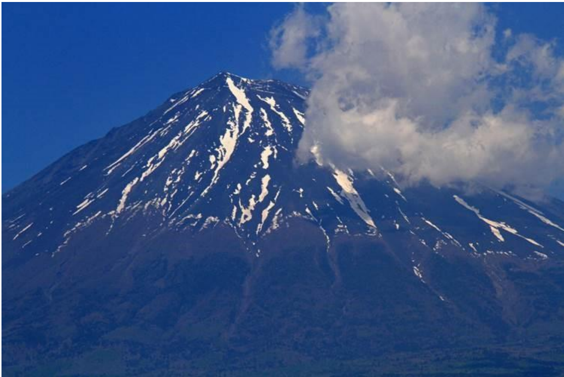
5.24 12 : 51