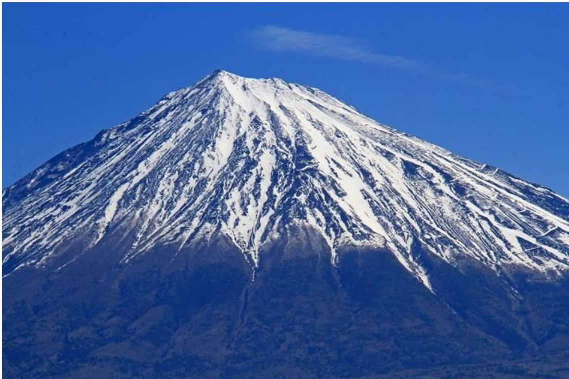
5.9 8 : 43