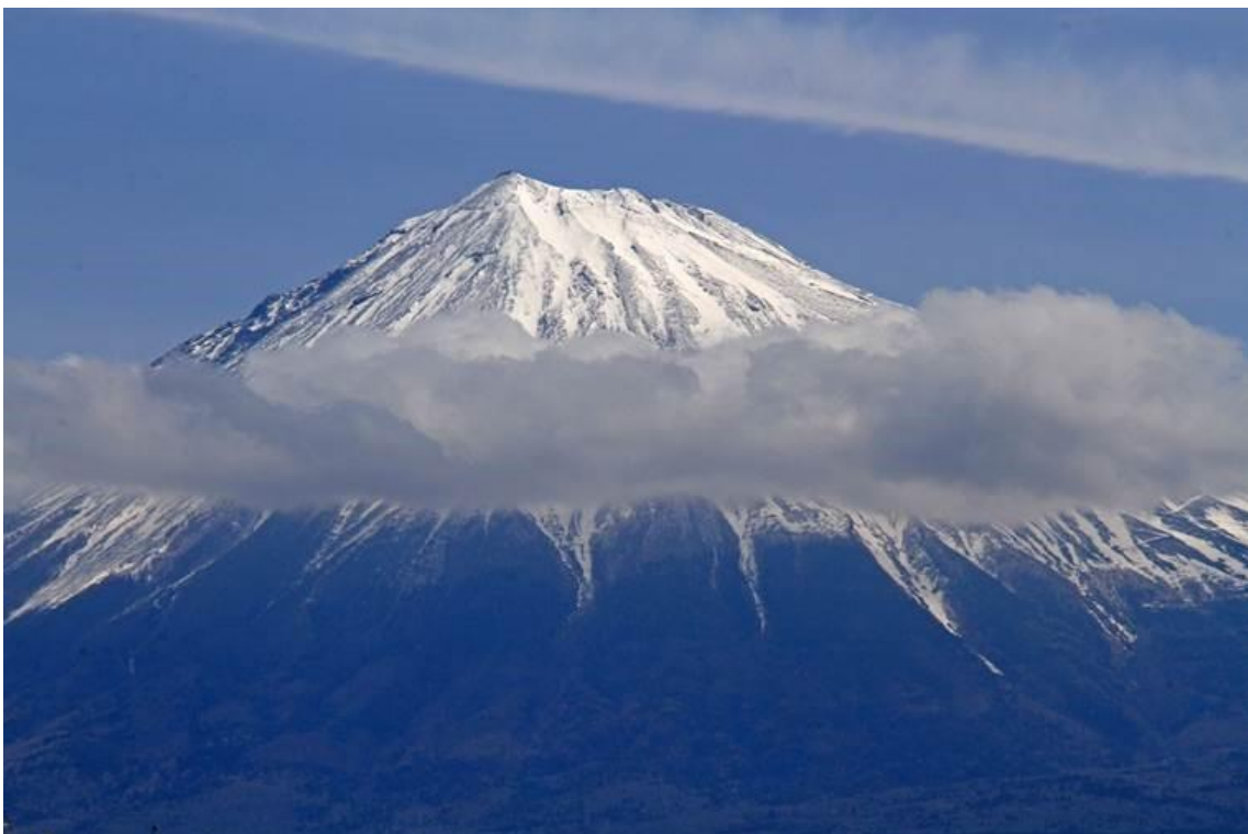
5.5 9 : 20