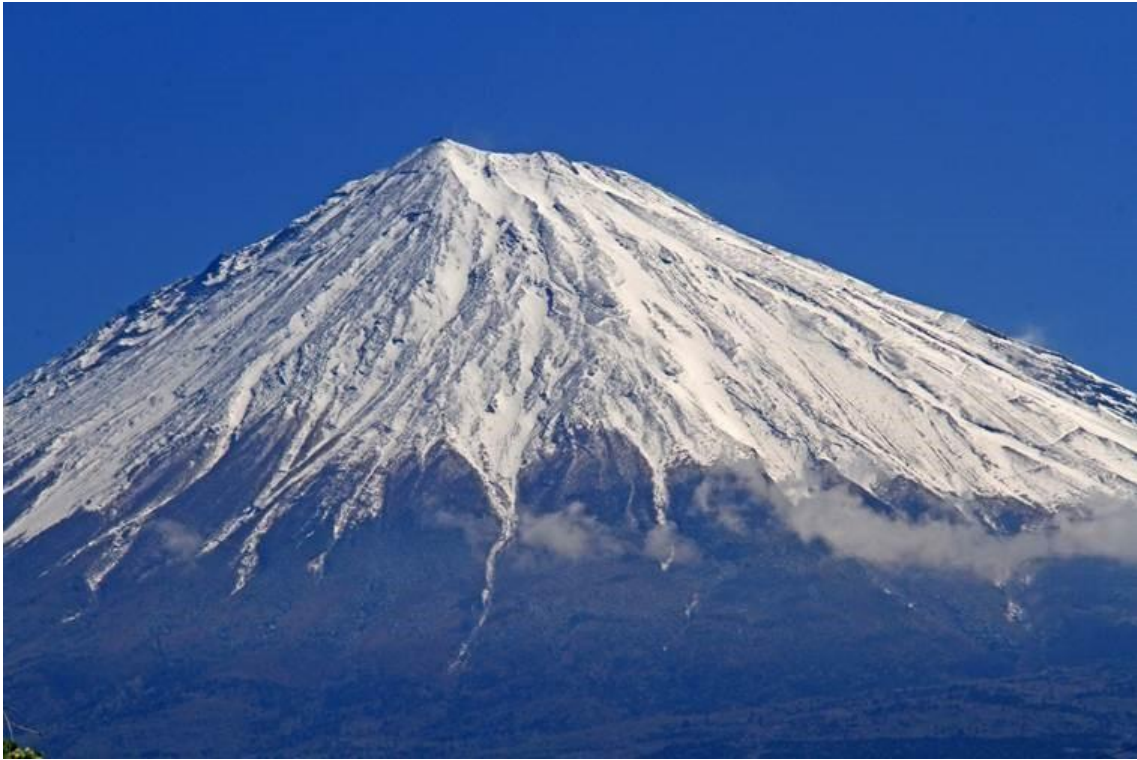
5.8 8 : 39