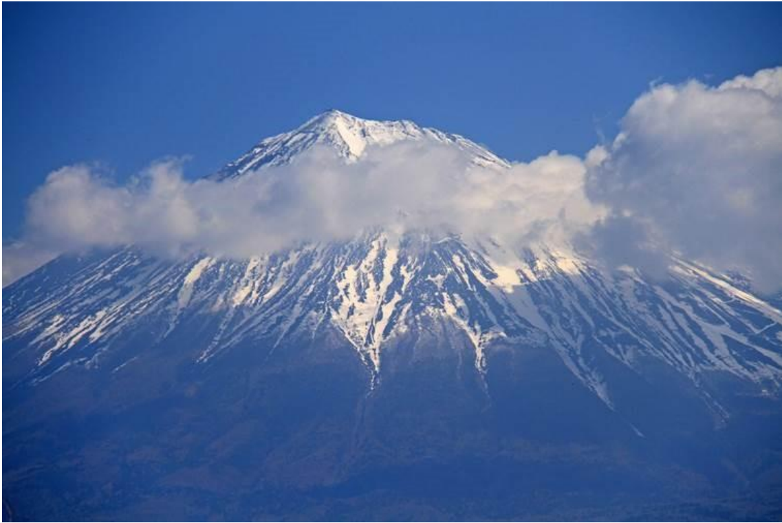
5.4 9 : 10