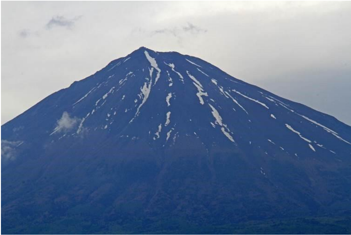
5.31 11 : 48