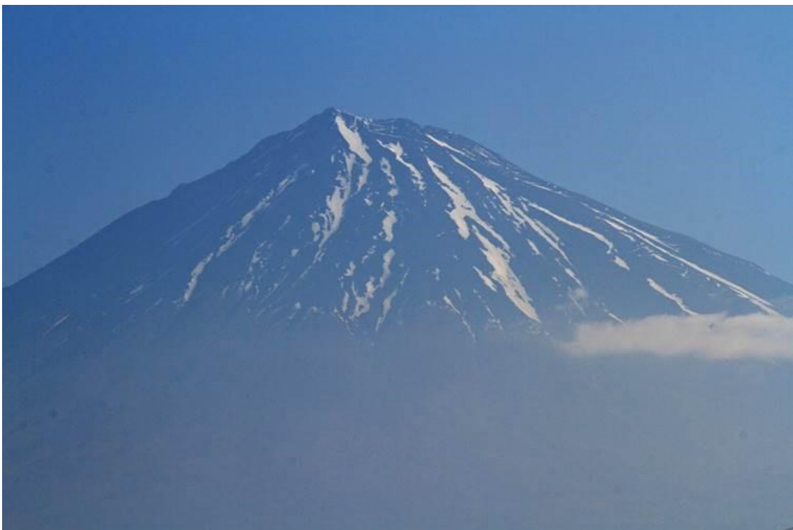
5.23 7 : 31 補正