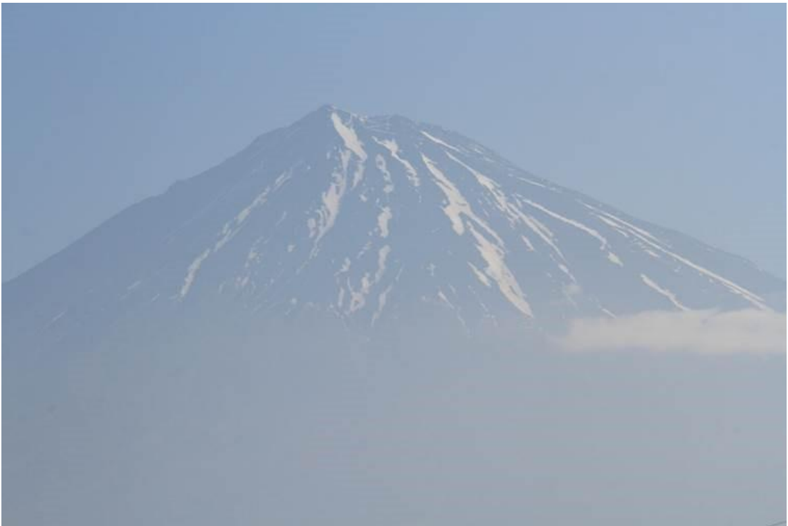
5.23 7 : 31