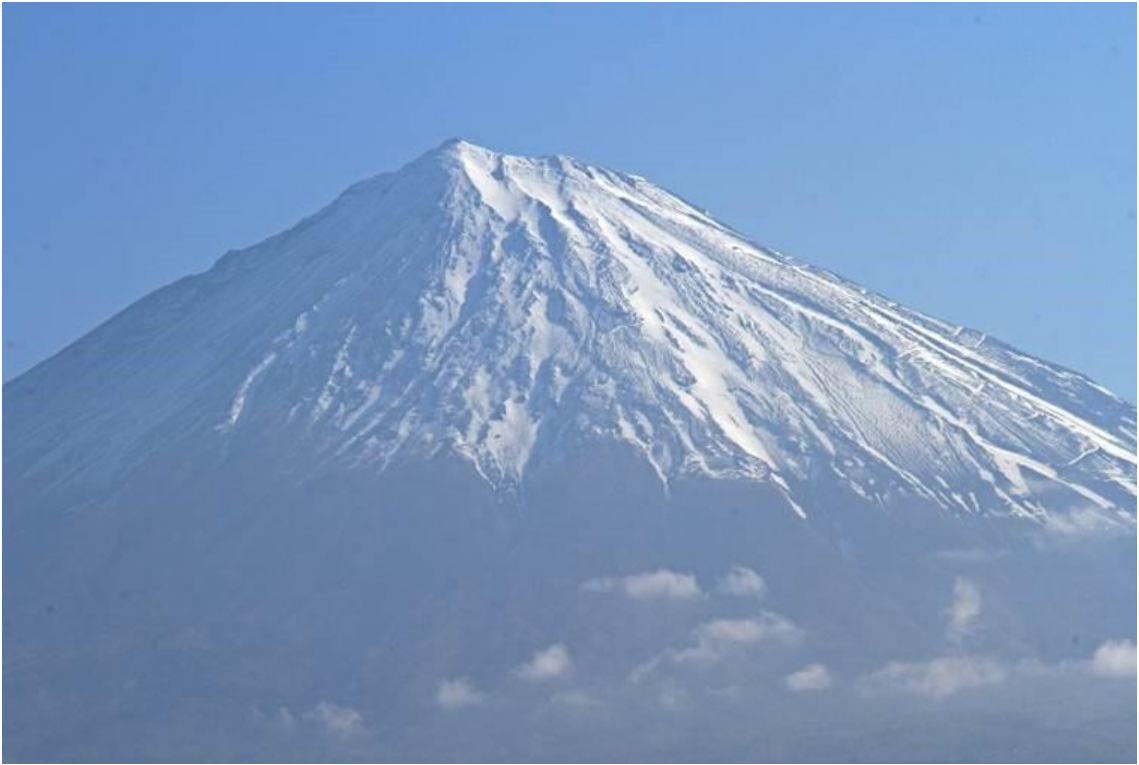
5.16 7 : 13