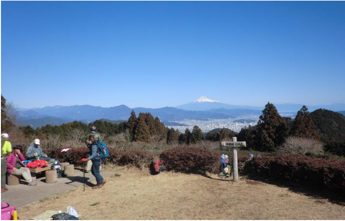
満観峰頂上からの富士山